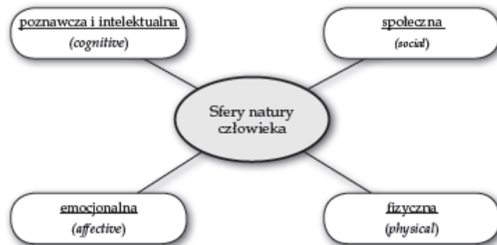
Diagram 2. Sfery natury człowieka