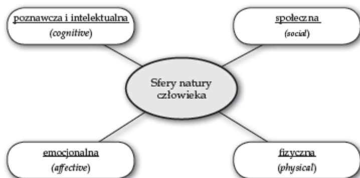
Diagram 2. Sfery natury człowieka